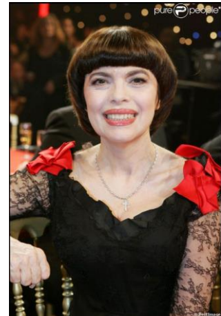
Mireille Mathieu, née le 22 juillet 1946, 22h, à Avignon